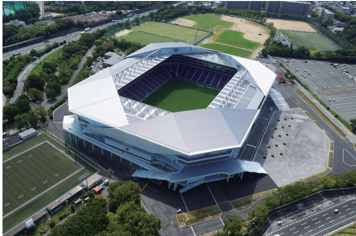
「第18回受賞建築物」 左上から下：青森県庁舎 耐震・長寿命化改修 東川町複合交流施設 せんとぴゅあ 陸前高田市立高田東中学校 右上から下：大宮区役所・大宮図書館 大阪府庁舎 本館 市立吹田サッカースタジアム